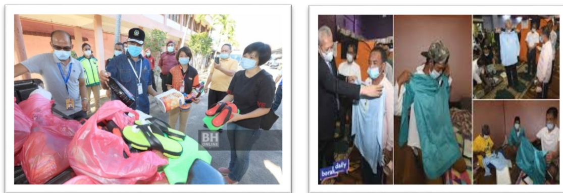
Gambar 3 dan 4 Sumbangan dari pelbagai agensi kerajaan dan bukan kerajaan, termasuk dari orang perseorangan.