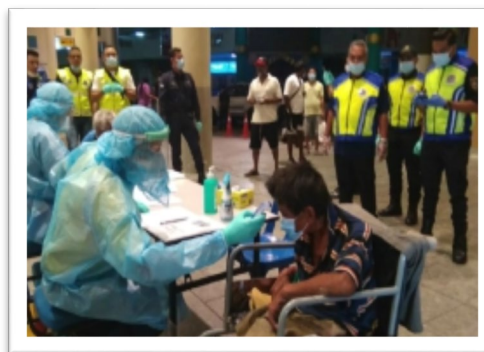
Gambar 5 dan 6 Saringan COVID-19 dan pemeriksaan kesihatan kepada penghuni pusat sementara gelandangan.

KKM telah memastikan maklumat mengenai COVID-19 dari segi kesan dan langkah-langkah pengawalan ditekankan dan disampaikan dengan menyeluruh kepada kakitangan dan penghuni pusat gelandangan termasuk aspek kebersihan diri, etika pernafasan/batuk, penjarakan sosial, (sekurang-kurangnya satu meter), sering