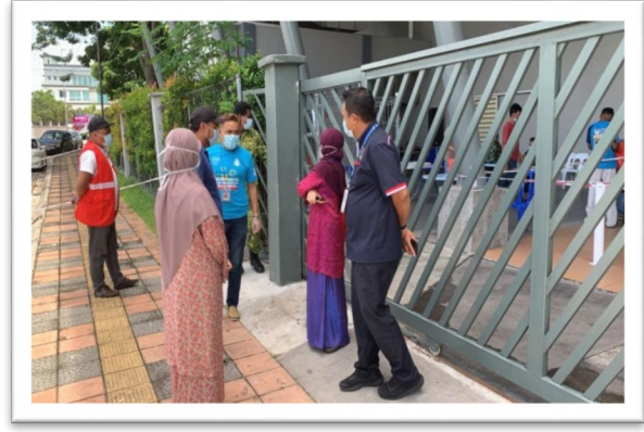
Gambar 7 dan 8 Pemantauan dan pemeriksaan prosedur operasi standard oleh pegawai-pegawai KKM dan agensi-agensi lain.

Penghuni pusat sementara gelandangan juga diberi rawatan perubatan asas bagi penyakit-penyakit akut dan kronik termasuk penjagaan luka (pencucian luka). Gelandangan yang mengidap masalah psikiatri telah dirawat oleh pakar perubatan dari KKM dan akan dirujuk bagi kemasukan ke wad sekiranya masalah tersebut tidak dapat dirawat di pusat sementara gelandangan. Bagi mereka yang mengalami masalah psikiatri ringan, kaunseling dan terapi psikologi diberikan oleh kaunselor-kaunselor dari Jabatan Kebajikan Masyarakat. Terdapat juga bekas penagih dadah dan sedang mendapatkan terapi penggantian metadon, juga mereka dibekalkan rawatan metadon oleh kakitangan KKM di pusat ini.