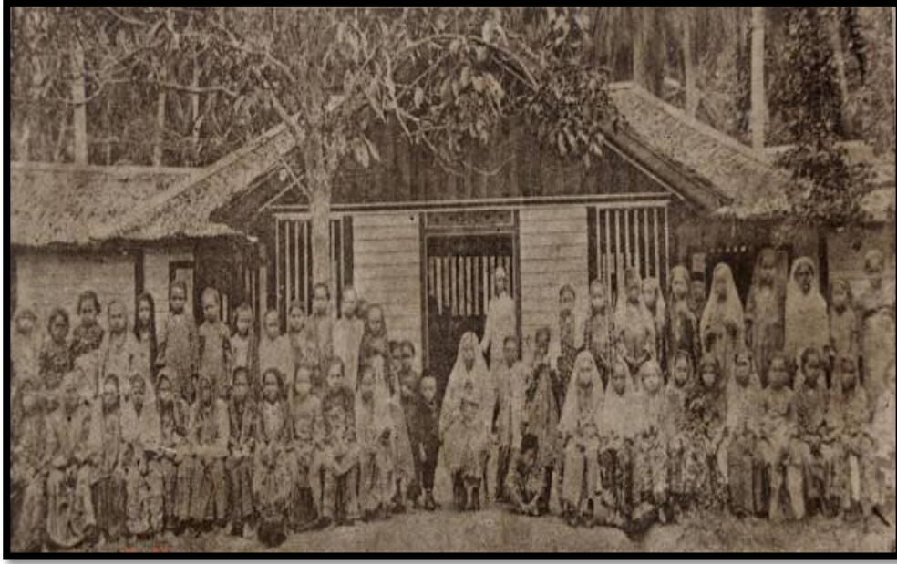
Gambar 2. Sekolah Perempuan di Kuala Langat.