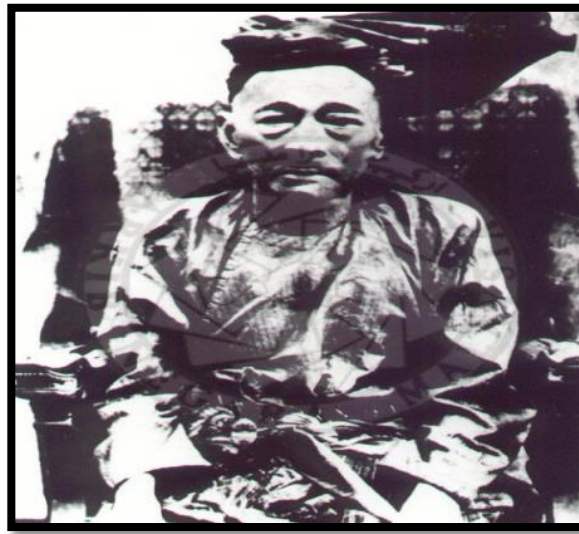
Gambar 1. Sultan Abdul Samad yang juga dikenali sebagai 'Marhum Jugra'.

Secara amnya, tempoh pemerintahan Sultan Abdul Samad di Selangor boleh ditinjau daripada tiga tahap.