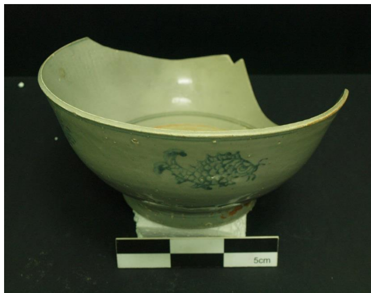
Foto 3. Mangkuk Seramik