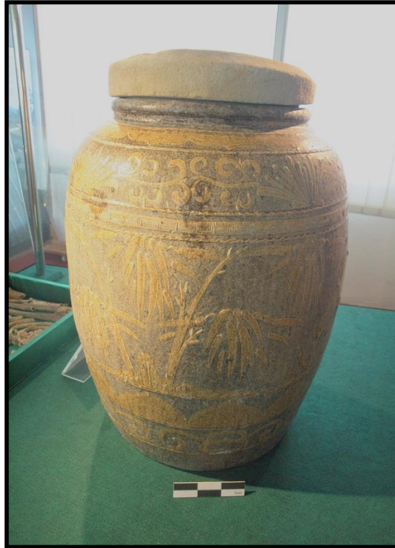
Foto 4. Jenis tjau yang bercorak