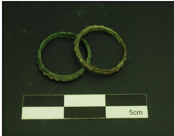
Foto 2. Gelang