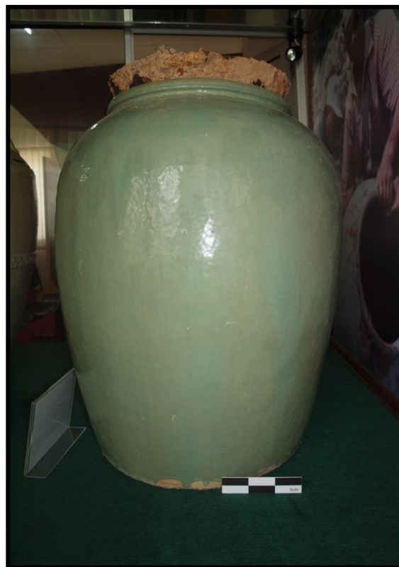
Foto 5. Tjau tanpa ukiran

Mulut tjau akan ditutup dengan menggunakan gong kecil atau penutup khasnya (Foto 6). Di sekeliling penutup tersebut dilekatkan atau dibalut dengan 'sempilut' sejenis sarang lebah kecil bagi