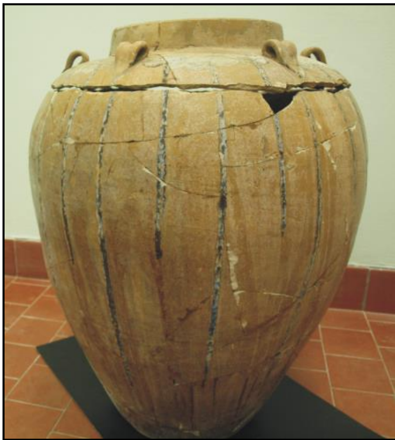
Foto 1. Bahagian tajau yang dipotong bagi memudahkan proses memasukkan mayat

Pemilihan berdasarkan kepada beberapa sebab, wanita mudah menerima pengajaran yang diperturunkan melalui lisan, memainkan peranan penting dalam soal adat dan pantang larang dan wanita mudah dimasuki oleh roh untuk memberitahu apa yang dikehendaki oleh roh-roh yang dipanggil oleh mereka. Komburongoh merupakan alat yang digunakan oleh bobolian untuk berhubung dengan roh-roh jahat. Bobolian akan membaca 'renait' atau jampi mantera untuk memohon restu kepada Kinorhingan supaya perjalanan roh si mati selamat. Mayat si mati akan dimandikan dan dipakaikan dengan pakaian yang cantik. Setelah selesai 'renait', barulah mayat tersebut dimasukkan ke dalam tajau. Bagi memudahkan mayat si mati dimasukkan ke dalam tajau, bahagian tengah tajau akan dipotong (Foto 1). Kedudukan si mati di dalam tajau tidak diambil kira, asalkan si mati tersebut boleh masuk ke dalam tajau tersebut. Berlainan keadaan mayat yang dijumpai di Indonesia, keadaan mayat dalam tempayan besar adalah dalam kedudukan berlipat ( flexed position ) (Satyawati Suleiman 1980).