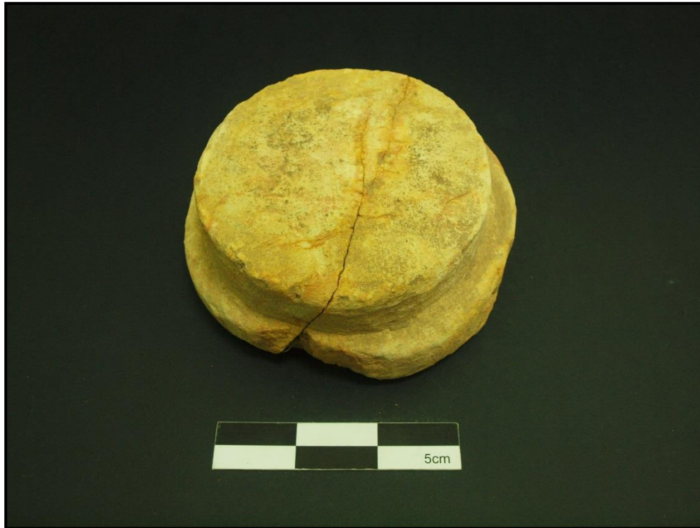
Foto 6. Penutup tajau