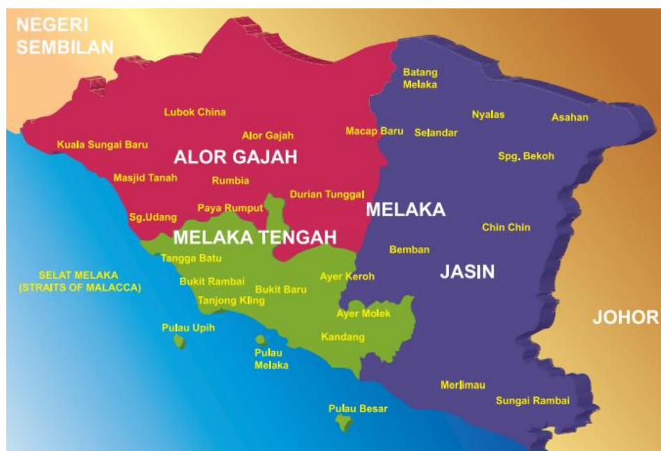
Peta 3. Peta Negeri Melaka