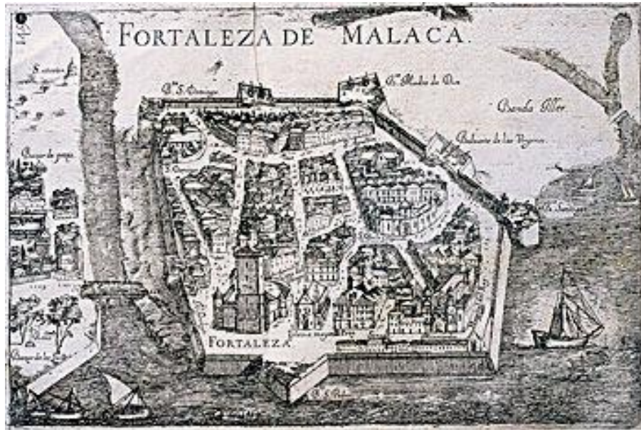
Gambar 1. Kota Melaka

Kristian. Peristiwa peperangan berlaku apabila Sultan Mahmud memerintahkan semua orang Portugis ditangkap kerana menganggap orang Portugis sebagai musuh Islam. Lanjutan daripada peristiwa tangkapan tersebut telah menyebabkan Portugis menyerang Melaka. Serangan tersebut diketuai oleh Alfonso de'Albuquerque yang merupakan seorang gabenor dan ketua nakhoda Portugis. Akhirnya, pada tahun 1511 Malaya berjaya ditawan oleh Portugis dan berakhirnya keagungan dan keunggulan Kerajaan Kesultanan Melayu Melaka. Alfonso de'Albuquerque telah membina kubu pertahanan selepas berjaya menawan Melaka yang dikenali sebagai Fortaleza De Malaca .