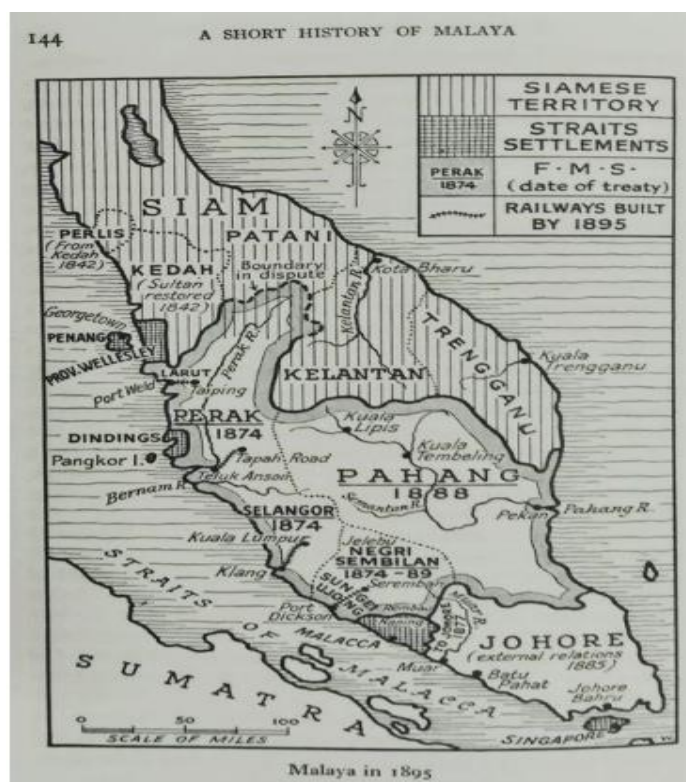
Peta 2. Melaka dan Negeri-negeri Melayu

cukai pertanian setelah cukai am kastam dihapuskan (Kratoska 1983). Pentadbiran British, berdasarkan kepada pengalaman mereka di India, menganggap keengganan Naning itu mencabar legitimasi penguasaan mereka ke atas Melaka. Bagi menerapkan legitimasi dan kuasa kedaulatannya terhadap wilayah dan perdagangan di Melaka maka Piagam Keadilan dilaksanakan seperti amalannya di India. British juga berpegang kepada prinsip bahawa dirinya sebagai pengganti kepada pemerintah tradisional setempat berhak mendapat semua hak yang pernah diterima atau dikuatkuasakan oleh pemerintah tradisional itu.