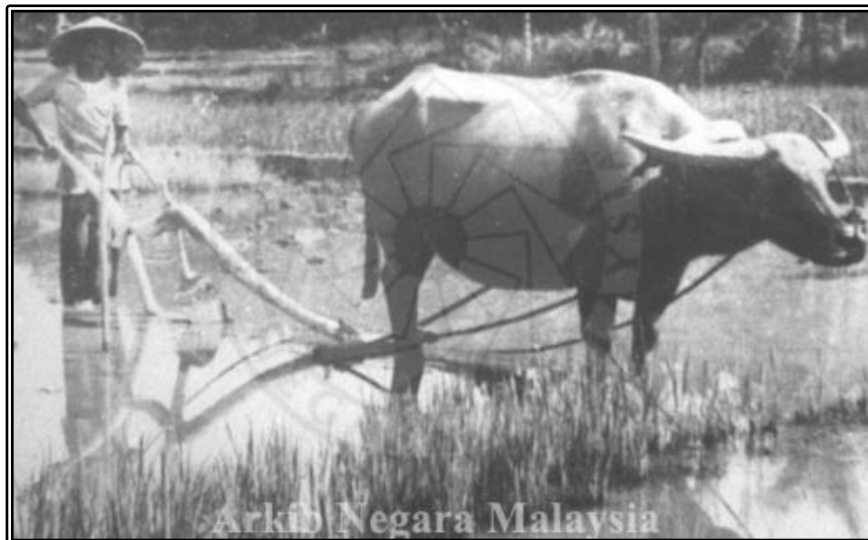
Gambar 2. Pertanian Tradisional di Melaka