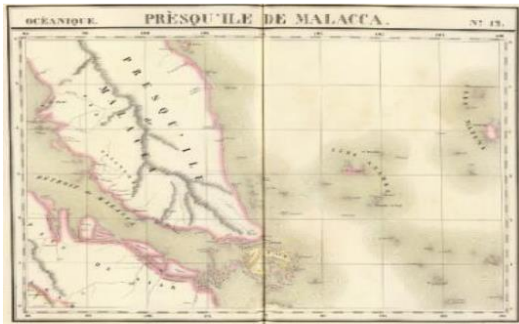
Peta 1. Peta Lama Negeri Melaka