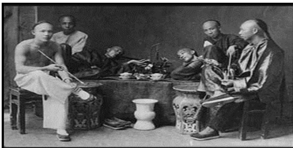
Gambar 2. Amalan Penghisapan Candu di Tanah Melayu.