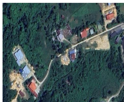
Peta 1 dan 2: Kampung-kampung Yang Terlibat Dalam Kajian

Esterberg (2002) menjelaskan bahawa kaedah kualitatif didapati paling sesuai untuk menerangkan dan menjelaskan proses sosial yang berlaku berdasarkan pendapat atau pengalaman individu dalam konteks tertentu. Dengan tata cara ini, definasi, ciri-ciri serta kegunaan tumbuhan herba dapat diperincikan dengan jelas dan tepat, selain penerangan daripada bidan perawat yang memproses tumbuhan sekaligus merawat pesakitnya. Tata cara penyelidikan turut melakukan kaedah rujukan-rujukan berasaskan sumber kedua, yakni melalui pembacaan daripada hasil-hasil penyelidikan yang telah diterbitkan sebagai maklumat tambahan mengenai kegunaan herba dalam proses rawatan tradisional masyarakat di Asia khusus yang melibatkan orang-orang Sama Bajau.