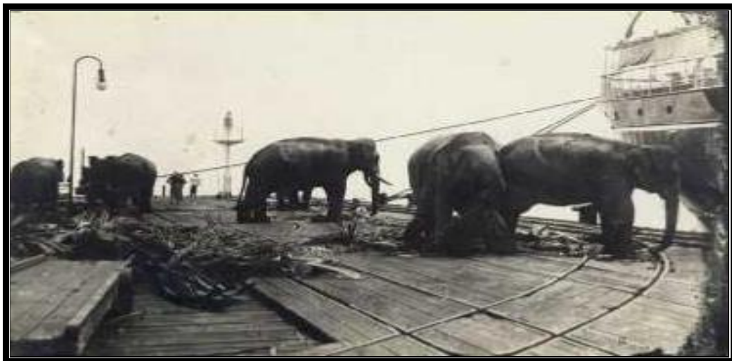
Rajah 7. Gambar Menunjukkan Gajah dihantar ke Siam dengan Menggunakan Kapal