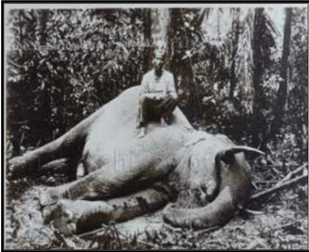
Rajah 8. Menunjukkan Seorang Lelaki Berada di samping Gajah yang diburunya di Bukit Gantang.