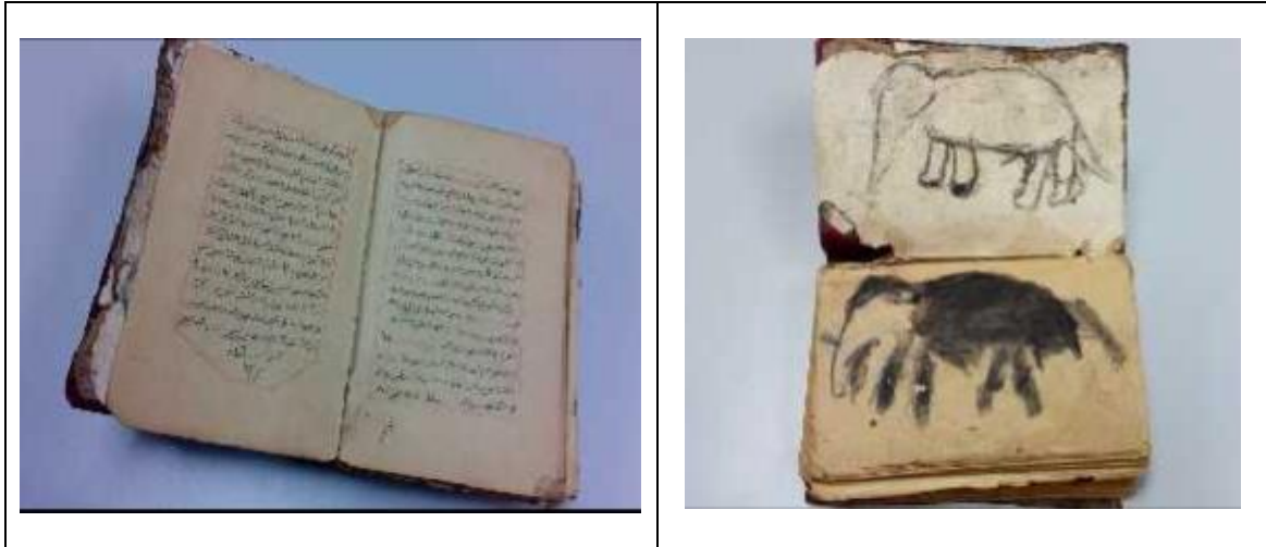
Rajah 4. Gambar Muka Belakang Naskhah Mantra Gajah yang berjudul 'Kitab Perubatan, Petua, Mantera, Azimat dan Isim bagi Gajah.