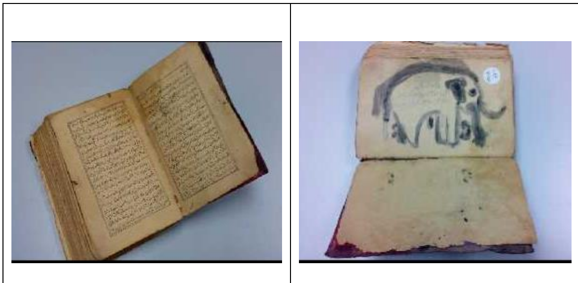
Rajah 3. Gambar Muka Hadapan Naskhah Mantra Gajah yang berjudul ‘Kitab Perubatan, Petua, Mantera, Azimat dan Isim bagi Gajah’