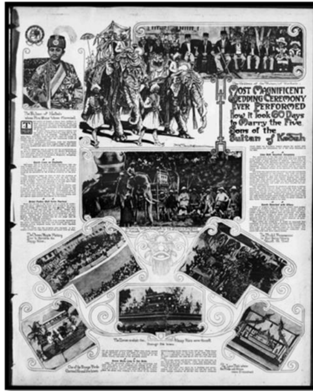
Rajah 6. Perkahwinan Anak-anak Sultan Kedah.

seorang mempelainya adalah Putera Mahkota iaitu Tunku Ibrahim dengan saudara sepupunya yang sulung iaitu Tengku Ayshah. Baginda merupakan puteri kepada Raja Muda Kedah (“Malay Potentates Marries Five Son”, The St. Paul Globe 1904). Perarakan dan perkahwinan anak Sultan Kedah ini dibuktikan lagi dengan gambar yang disediakan di bawah. Gambar ini menunjukkan pelbagai delegasi asing yang hadir ke perkahwinan tersebut dengan menggunakan gajah sebagai lambang kebesaran sesebuah kerajaan