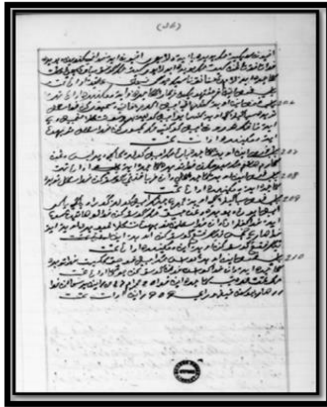
Rajah 2. Muka Belakang Naskhah Mantera Gajah