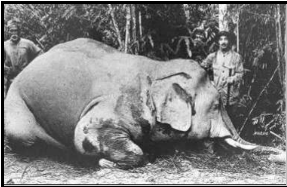
Rajah 9. Menunjukkan Dua Orang Lelaki bersama 'hadiah' (gajah) yang diperolehi daripada Kegiatan Pemburuan Mereka