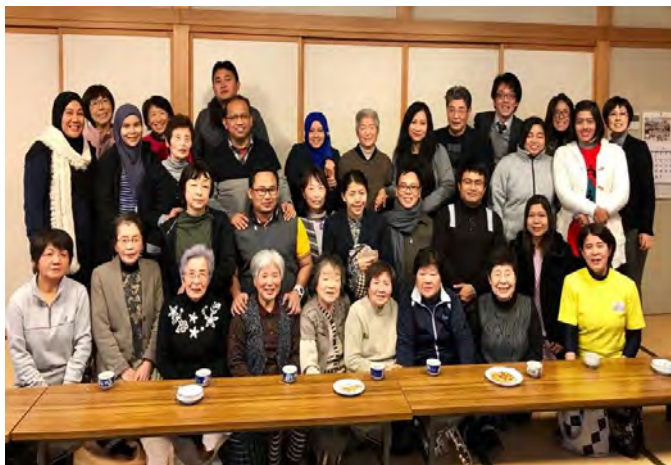
Gambarajah 23 Bergambar kenangan bersama warga emas

dilatih oleh pelatih sukarela yang pakar dalam kesihatan warga emas.