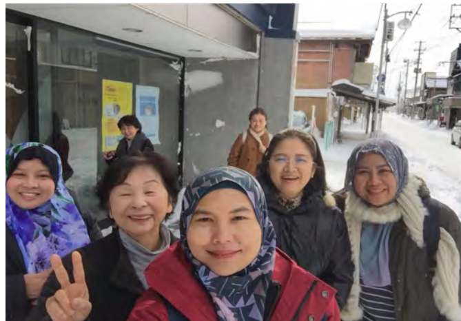
Gambarajah 20 Aktiviti bersama warga emas

lebih 80 tahun, mereka masih kelihatan sihat dan cergas.