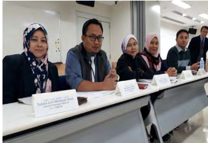
Gambarajah 16 Sesi pembentangan dan diskusi antara Myanmar-Malaysia-Japan di Iryojin