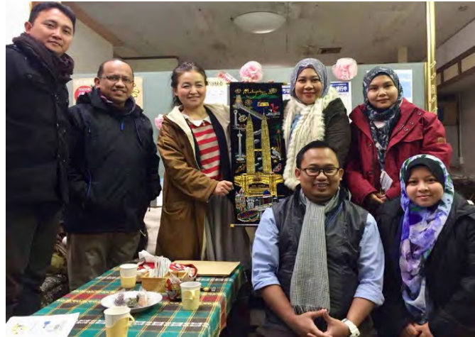
Gambarajah 18 Lawatan ke Chanoma