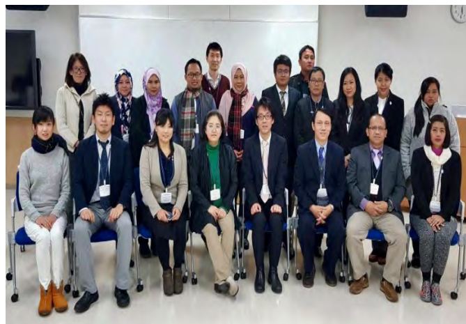
Gambarajah 17 Bergambar kenangan antara pelajar Myanmar-Malaysia-Japan

Perbincangan kami tidak terhenti disitu sahaja. Kami seterusnya dibawa ke sebuah restoran eksklusif @Rivage untuk menikmati makan malam bersama-sama para penyelidik dari Jepun sebagai salam perkenalan dan hubungan untuk kajian pada masa akan datang.