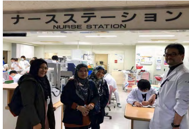
Gambarajah 9 Kakitangan kesihatan seperti doktor, doktor pelatih dan pelajar perubatan berkumpul untuk melihat rekod pesakit secara sepenuhnya menggunakan elektronik iaitu paperless system

Walaupun hari telah berganjak petang (siang lebih pendek) kami diberi task @kerja kumpulan yang harus disiapkan sebelum hari pembentangan pada 24 haribulan nanti. Task tersebut adalah mengenai “Current Situation of Ageing and UHC in my Country”. Kami pulang agak lewat kira-kira 7.00 malam dan pada waktu itu di mana hari sudah gelap. Walau bagaimanapun kami amat teruja kerana salji telah turun dengan lebatnya. Ia merupakan pengalaman pertama buat kami kaum wanita, tetapi bagi kaum lelaki, ini hanyalah imbasan pengalaman di masa lalu.