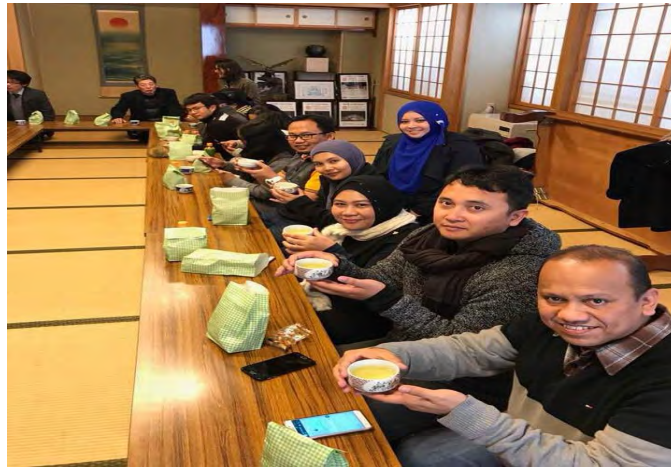
Gambarajah 21 Ketibaan di Iki-Iki salon

Walaupun sampai agak lewat, kami masih disambut mesra oleh warga emas di Iki-Iki salon. Ia merupakan kelas 'preventive long term care' untuk warga tua di sana.