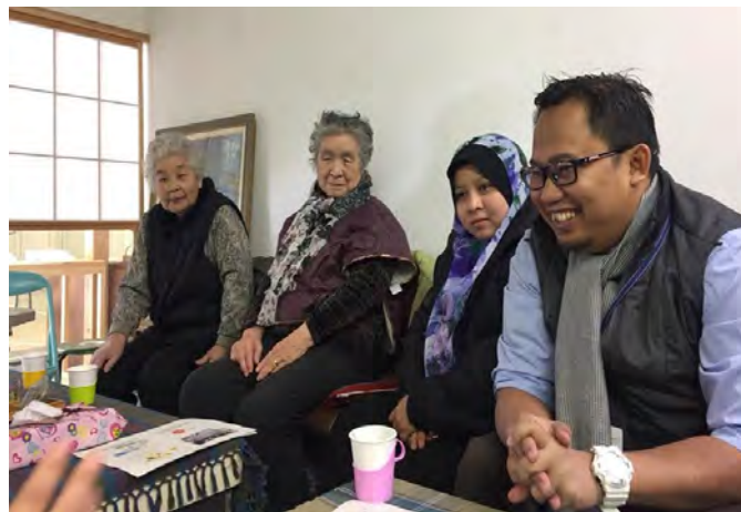
Gambarajah 19 Beramah mesra bersama warga emas

Sesi perkenalan dan ramah mesra bersama beberapa penduduk di sana. Walaupun berumur