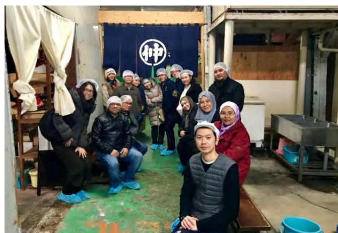
Gambarajah 4 Lawatan ke kilang Miso (sup Miso) di Minemura Syoten

Kemudian kami dibawa untuk check-in di Hotel Marutani seterusnya sedikit taklimat dan orientasi program diberikan oleh Miss Manabe.