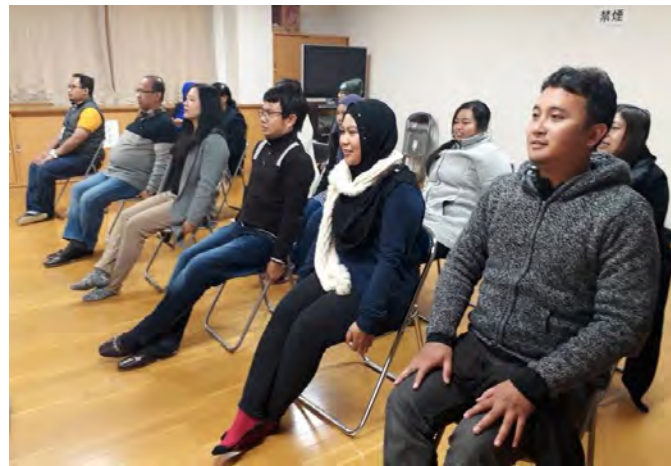
Gambarajah 22 Aktiviti riadah bersama warga emas

Kami turut serta bersama warga emas di sana melakukan aktiviti riadah yang menarik dan bersesuaian dengan umur mereka. Mereka juga