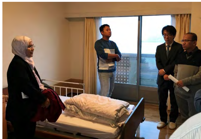
Gambarajah 13 Taklimat di pusat jagaan orang-orang tua @ Sekiya-omoto en

kebajikan dan keselamatan mereka terjamin semasa ketiadaan anak-anak di rumah. Sesetengah daripada mereka adalah penghuni harian bermaksud berulang-alik dari rumah masing-masing menggunakan kenderaan yang disediakan (seperti konsep daycare).