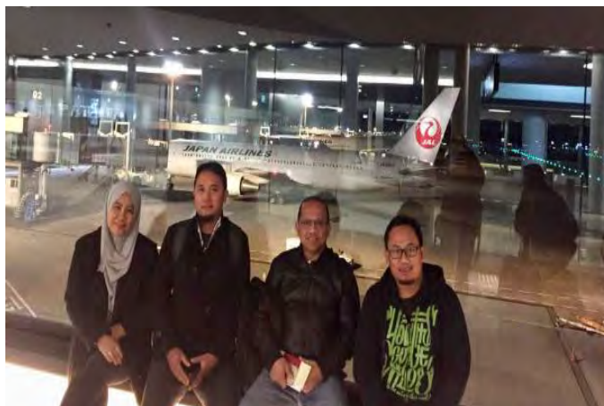
Gambarajah 1 Ketibaan di lapangan terbang Narita, Tokyo