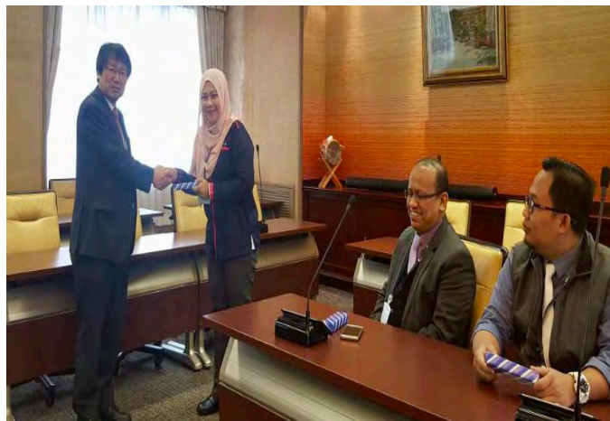
Gambarajah 15 Pertukaran cenderahati antara wakil Malaysia dan Universiti Niigata