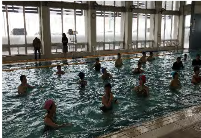
Gambarajah 26 Senaman aquatic yang disertai oleh warga emas di 'Hidamari pool'

Kemudiannya kami di bawa ke tempat lawatan terakhir iaitu Hospital Tokamachi. Ia merupakan sebuah hospital kerajaan bertaraf hospital daerah. Wad-wadnya dipenuhi oleh warga emas dan sebab kemasukan ke hospital adalah jangkitan paru-paru dan strok. Setelah itu kami