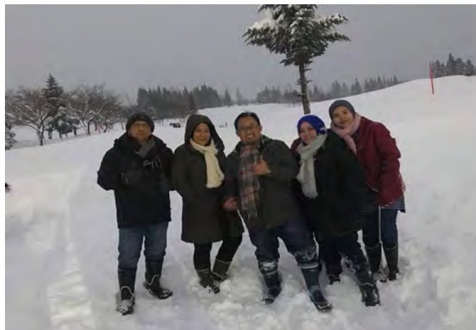
Gambarajah 25 Persekitaran bersalji di Hotel Benatto

Manabe yang sentiasa mengiringi kami sepanjang program ini. Kami meneruskan aktiviti terakhir kami dengan menikmati salji yang lembut dan pemandangan yang indah pada malam tersebut.