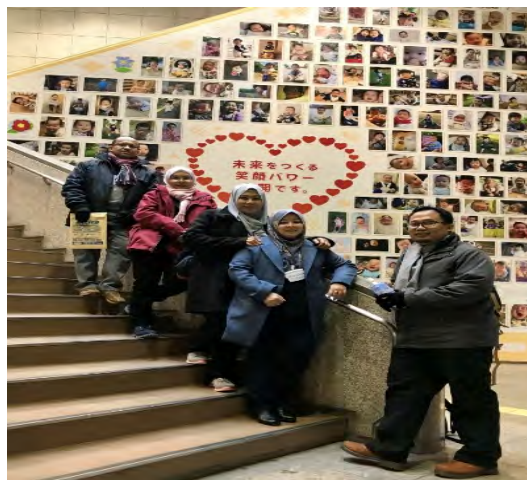
Gambarajah 11 Bergambar kenangan di bangunan Pembangunan Kesihatan dan Kebajikan di Niigata Perfecture

Pada sebelah petang pula, kami dibawa melawat ke pusat jagaan orang-orang tua @ Sekiya-omoto en. Kami disambut mesra oleh kakitangan dan penghuni pusat tersebut. Kebanyakan penghuni berumur antara 60 hingga 93 tahun yang masih boleh bergerak sendiri. Banyak kelengkapan dan keperluan asas seperti bilik mandi, bilik air telah direka khas untuk kemudahan warga tua bagi mengurangkan kadar kecederaan. Begitu juga van