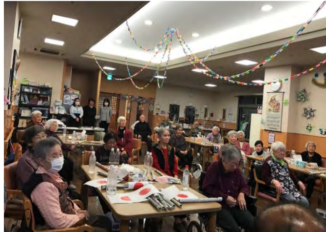
Gambarajah 12 Pusat jagaan orang-orang tua @ Sekiya-omoto en

Aktiviti harian mereka di waktu pagi adalah senaman ringan walaupun di atas kerusi. Seterusnya melakukan kraftangan untuk memberi pergerakan motor badan. Konsep pusat jagaan di sana adalah menggalakkan warga emas melakukan aktiviti sosial bersama-sama rakan atau komuniti bagi mengelakkan kemurungan serta memastikan