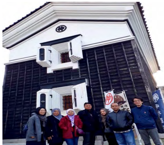
Gambarajah 3 Kilang Miso (sup Miso) yang terkenal di Kawasan Minemura Syoten

tersebut telah berusia dan beroperasi lebih dari 100 tahun, tapi tahap kebersihan dan sistem pembuatannya amat bersih dan baik.