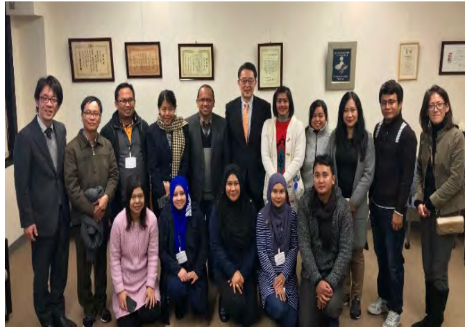
Gambarajah 24 Ketibaan di Pejabat Kesihatan Tokamachi