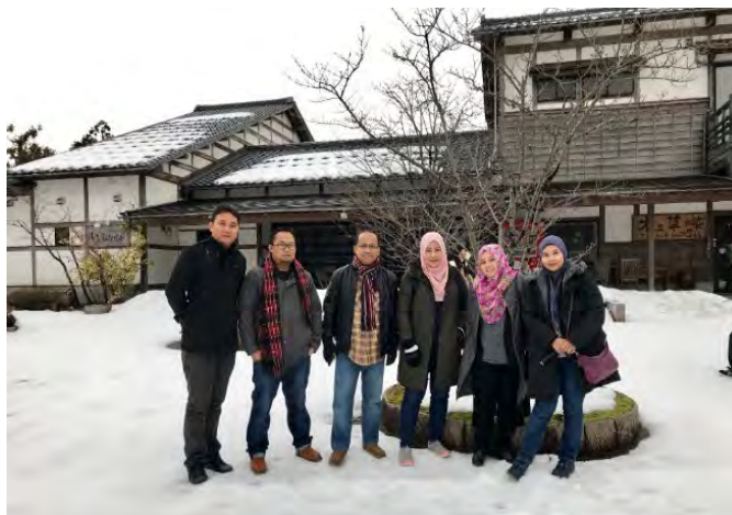
Gambarajah 5 Lawatan ke “The Northern Culture Museum”

Malah rumah tersebut adalah sumbangan dari golongan bangsawan tersebut. Kawasannya amat cantik serta diliputi salji memutih pastinya memukau pandangan kami pada ketika itu.