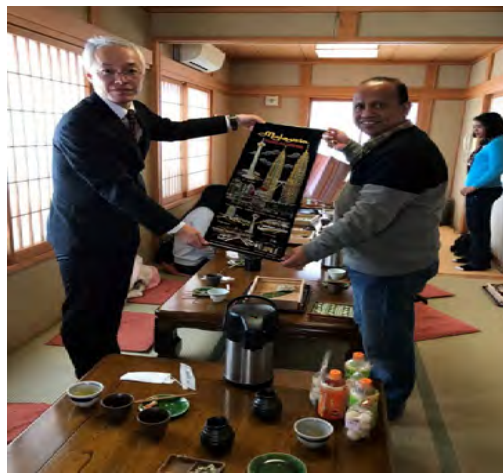
Gambarajah 27 Bertukar Cenderahati dengan Pengarah Hospital Tokamachi

dihidangkan dengan makanan terkenal di sana iaitu Mee Soba. Rasanya yang unik serta dihidangkan bersama sup sejuk (sengaja disejukkan), pasti menimbulkan suatu pengalaman baru buat kami serta di makan bersama-sama tempura yang sedap dan rangup.