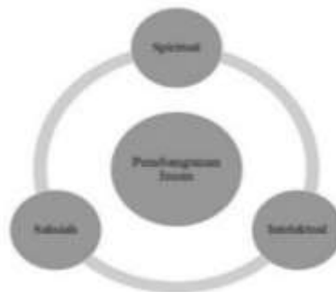
Rajah 3: Elemen Pembangunan Insan.

Kesimpulannya, berdasarkan kepelbagaian definisi kefahaman dalam menterjemahkan maksud pembangunan insan, dapat dirumuskan bahawa pembangunan insan adalah suatu pembentukan keperibadian berkualiti seseorang individu samada dari aspek rohani mahupun jasmani bersumberkan kepada konsep Islam menurut al Quran dan Sunnah Rasulullah SAW. Antara elemen yang terdapat di dalam pembangunan insan adalah spiritual yang terdiri daripada cabang kesejahteraan rohani, intelek dari sudut ilmu pengetahuan dan sahsiah dari sudut akhlak peribadi dan sosial. Justeru, Rajah 3 menunjukkan rumusan elemen bagi pembangunan insan