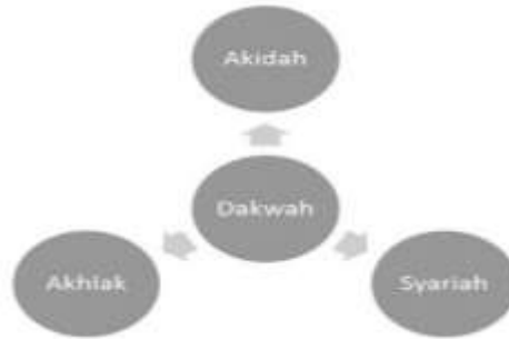
Rajah 1: Elemen asas dakwah.

Menurut Ya'qub Muhammad Hussin (2001), usrah mempunyai tujuan-tujuan yang lebih khusus. Antara tujuan-tujuan utama Usrah ialah memberi kefahaman yang benar dan jelas terhadap Tasawwur Islam kepada anggota supaya dapat menentukan sikap atau hukum terhadap sesuatu perkara atau permasalahan. Selain itu, matlamat usrah adalah untuk meningkatkan penghayatan amal Islami dan menghidupkan rasa tanggungjawab untuk menjaga dan mempertahankan kemuliaan dan ketinggian ajaran Islam sama ada secara peribadi ( fardi ) atau berkumpulan ( jama`ah ) juga menjalin dan mengukuhkan ikatan ukhuwah dan persaudaraan serta memupuk semangat dan bekerja secara berjemaah. Kesimpulannya, melihat kepada pengertian dan matlamat kepada pendekatan usrah tersebut, jelas menunjukkan bagaimana besarnya penekanan yang diberikan dalam proses pembinaan insan dalam menambah baik kefahaman dan amalan terhadap kehidupan beragama berteraskan kepada Al Quran dan Sunnah Rasulullah. Rajah 2 menyimpulkan berkaitan pendekatan usrah hasil daripada kefahaman tersebut.