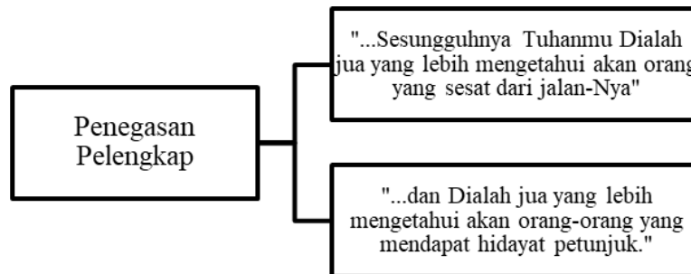
Rajah 2: Dua Penegasan Pelengkap Bagi Tasawwur Metodologi Dakwah

Dalam menyampaikan dakwah, kandungan dakwah seseorang pendakwah dan penulis dakwah tidak boleh bernada menghukum sasaran dakwah sama ada ia bersifat hukuman di dunia apatah lagi hukuman di akhirat kelak. Hal ini kerana tugas dan kewajipan pendakwah atau penulis dakwah adalah mengajak dengan hikmah, menasihati mereka dengan baik dan berbahas dengan mereka dengan cara yang terbaik. Berkaitan dengan natijah mereka di akhirat kelak, para pendakwah wajib menyerahkannya secara mutlak kepada Allah SWT. Terdapat dua penegasan Allah SWT dalam bahagian kedua ayat ini. Secara lebih jelas lagi perkara ini ditunjukkan dalam Rajah di bawah.