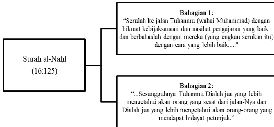
Rajah 1: Pembahagian Kandungan Ayat 12 Daripada Surah al-Nahl (16)

penegasan penting Allah SWT yang menjadi pelengkap kepada tasawur metodologi dan gerak kerja dakwah. Untuk lebih jelas lagi, perkara ini dijelaskan dalam Rajah 1.