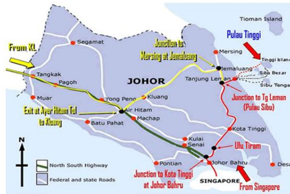
Rajah 1: Kedudukan Pulau Tinggi dalam Daerah Mersing, Johor

Rajah 1 di bawah menunjukkan kedudukan Pulau Tinggi dalam Daerah Mersing, Johor.