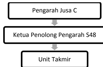
Rajah 2 Struktur Organisasi Bahagian Pengurusan Masjid dan Surau JHEAINS

Jawatankuasa Takmir ini dibahagikan kepada tiga komponen utama: