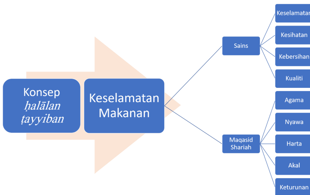
Rajah 2: Hubung kait konsep halālan tayyiban , keselamatan makanan dan impaknya terhadap sains dan Syariah

Sejajar dengan itu, aspek penjagaan harta juga terganggu kerana penyakit yang dihidap akibat pengabaian konsep halālan tayyiban memerlukan kos perubatan yang tinggi bagi mengekalkan seseorang individu dalam keadaan terkawal dan baik walaupun tidak dapat mengembalikan kesihatan seperti sedia kala. Daripada aspek penjagaan akal dan keturunan, pengambilan makanan akan membentuk darah daging sekali gus mempengaruhi aspek fizikal, spiritual, akhlak, intelek dan cara pemikiran (Halipah & Hanani, 2019). Sehubungan dengan itu, tanpa disedari perkara ini memberi kesan kepada pembentukan individu pada waktu kini dan generasi akan datang. Lebih membimbangkan, mereka merupakan tunggak yang akan memimpin negara satu masa nanti.