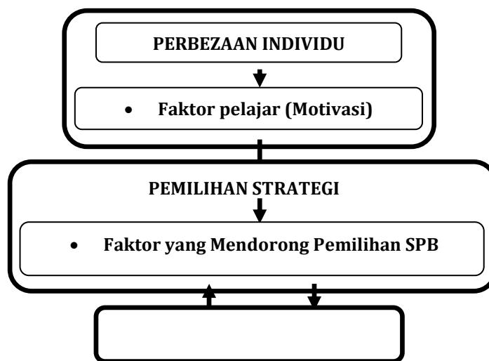
Rajah 1: Model pemilihan strategi pembelajaran bahasa pelajar asing Diubah suai daripada Ellis (1994)

Penyelidikan ini menggunakan model Pemilihan Strategi Pembelajaran Bahasa Pelajar Asing (Model Pemilihan SPBPA) yang telah diadaptasi daripada model strategi pembelajaran bahasa yang telah diperkenalkan oleh Ellis (1994). Ini kerana, dalam kajian ini, pengkaji melihat faktor pelajar dari segi motivasi, iaitu sama ada pelajar asing lebih bermotivasi integratif atau instrumental dalam memilih strategi pembelajaran bahasa. Rajah 1 merupakan model strategi pembelajaran bahasa yang diubah suai daripada Ellis (1994).