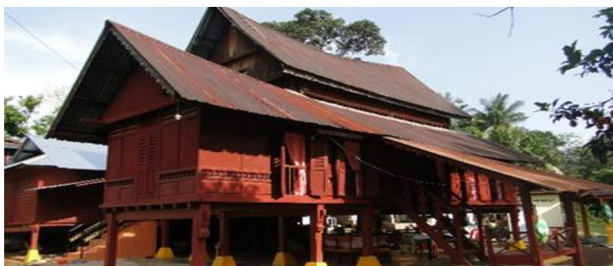
Rajah 1 : Rumah tradisional di Pulau Mampat, Rembau, Negeri Sembilan.

Masyarakat di Negeri Sembilan terdiri daripada penghijrahan dan kedatangan masyarakat Minangkabau. Terdapat dua kumpulan penghijrahan Minangkabau yang datang ke Negeri Sembilan iaitu yang datang dari daerah pedalaman Sumatera mengamalkan sistem Adat Perpatih sementara kumpulan kedua datang dari daerah persisiran Sumatera dan mengamalkan Adat Temenggung. Masyarakat Minangkabau adalah etnik yang sering di katakan orang merantau, mereka bergerak di seluruh negara mencari kehidupan yang lebih baik, pendidikan, dan pengalaman. Melalui aktiviti merantau, masyarakat Minangkabau membawa budaya dan tradisi mereka. Ia membina identiti berkaitan dengan ciri budaya kumpulan etnik. Menurut Mochtar Naim (1984), orang Minangkabau yang merantau sangatlah tinggi, bahkan tertinggi di Indonesia. Dari hasil kajian yang pernah dilakukan oleh beliau, pada tahun 1961 terdapat sekitar 32% orang Minang yang tinggal di luar Sumatera Barat. Kemudian pada tahun 1971 jumlah itu meningkat menjadi 44% . Berdasarkan bancian tahun 2000, suku Minang yang tinggal di Sumatra Barat berjumlah 3,7 juta orang, dengan anggaran hampir satu perdua orang Minang berada di perantauan. Minangkabau atau Minang adalah merupakan kumpulan etnik Nusantara dan aset bagi Sumatera terhadap budaya dan sejarah. Minangkabau meliputi Sumatera Barat, separuh darat Riau, bahagian utara Bengkulu, bahagian barat Jambi, bahagian selatan Sumatera Utara, barat daya Aceh, dan juga Negeri Sembilan.