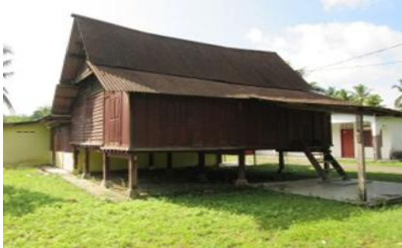
Rajah 14 : Rumah Negeri Sembilan tidak beranjung.

Secara umumnya, rumah Melayu Tradisional Negeri Sembilan mempunyai bumbung panjang iaitu jenis yang mempunyai satu perabung yang memanjang dari kiri ke kanan atau arah hulu ke hilir selari dengan jalan atau sungai. Evolusi rumah Negeri Sembilan dapat dilihat pada bumbungnya yang melentik sedikit seperti dalam (rajah 17). Reka bentuk rumah Negeri Sembilan mempunyai atap yang bertingkat antara atap bumbung rumah hadapan (rumah ibu) dengan atap serambi. Rumah yang sama dengan rumah induk mempunyai serambi, dapur yang bergabung dengan rumah ibu. Berpanggung serta dikaitkan dengan 12, 16 dan 20, tiang berlantai tinggi dari tanah dan bertangga kayu adalah merupakan imej dan elemen yang kuat yang diperkatakan sebagai rumah melayu adat Negeri Sembilan.