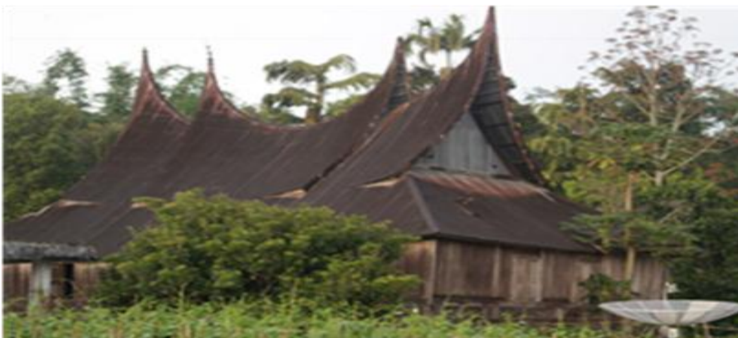
Rajah 3 : Bentuk bumbung rumah gadang yang terdapat di Luhak Agam.

Rumah Minangkabau mempunyai bumbung ditarik balik sebagai bentuk tanduk kerbau, berfungsi sebagai tempat tinggal yang didiami oleh anggota keluarga perempuan sahaja.