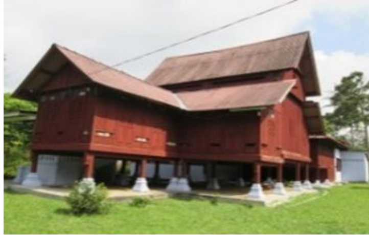
Rajah 18 : Rumah Negeri Sembilan berserambi satu dan beranjung.

Serambi terdiri dari serambi hujung, serambi tengah dan serambi pangkal. Serambi yang paling hampir dengan tangga di panggil serambi pangkal, menunjukkan ia adalah serambi pangkal dan paling jauh di panggil serambi hujung. Dalam pada itu menurut Yaakub Idrus (1996), terdapat empat (4) jenis variasi yang berdasarkan kepada penambahan di bahagian serambi seperti jenis tidak beranjung, jenis beranjung satu, jenis beranjung dua dan jenis beranjung tiga (rujuk rajah 16, 17, 18, 19 dan 20) Rumah beranjung adalah rumah berevolusi yang pada asalnya bermula dari jenis rumah tidak beranjung seperti dalam (rajah 15).