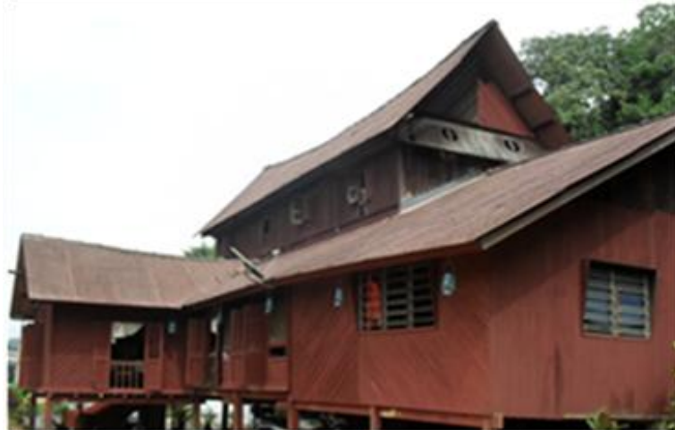
Rajah 9: Rumah tradisional Negeri Sembilan berbumbung lentik