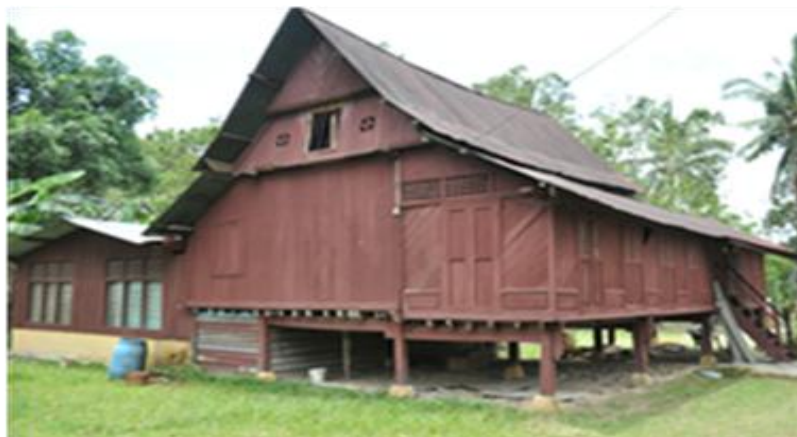
Rajah 8 : Rumah Negeri Sembilan, tingkap kecil pada loteng (peran)

Setiap bahagian ini mempunyai fungsinya yang tersendiri mengikut kepada keperluan sama ada pada waktu harian biasa atau semasa mengadakan majlis-majlis adat. Merujuk kepada (rajah 7), fungsi ruang pada rumah Kampar ini juga mirip kepada rumah Negeri Sembilan. Rekabentuk rumah Negeri Sembilan mempunyai beberapa tipologi yang mengikut ruang serambi di mana serambi yang dekat dengan tangga dipanggil serambi pangkal dan serambi yang jauh dengan tangga di panggil serambi hujung. "Pangkal untuk orang adat, hujung untuk orang syarak dan penghulu" (Nafida 2007). Selain serambi, ruang-ruang lain seperti rumah ibu (tengah rumah dan bilik) serta loteng (peran) juga terdapat pada rumah tradisional Negeri Sembilan dan mempunyai fungsi yang sama seperti pada rumah induk dan Kampar-siak.