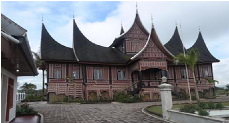
Rajah 5: Rumah Gadang yang banyak terdapat di Luhak Tanah Datar.

Namun menurut Desy Aryanti pula, rumah adat Minangkabau adalah sebuah rumah yang didiami berdasarkan aturan-aturan adat dan digunakan oleh anggota keluarga yang mengamalkan sistem kekerabatan matrilineal sebagai pusat kegiatan keluarga. Maksudnya ialah sebagai rumah yang menepati ruang mengikut keluarga atau kelompok besar atau kecilnya berdasarkan kedudukan atau ekonomi keluarga mengikut adat. Bilangan bilik seperti dalam (rajah 4 dan 5), menunjukkan taraf atau status sesuatu keluarga.