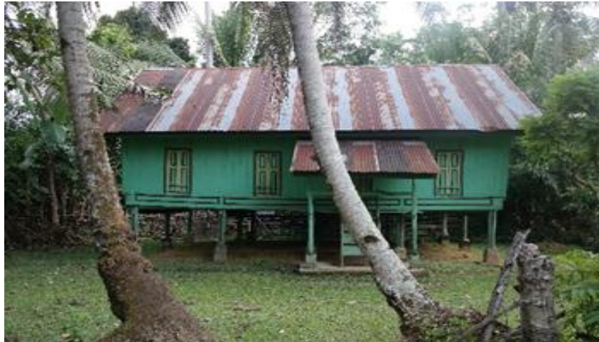
Rajah 13 : Rumah Kampar-siak (Kg. Lipat Kain)

Antara reka bentuk rumah di Kampar, terdapatnya ruang tingkat seperti loteng dengan terdapatnya tangga diruang tungganai, ini dapat dilihat dalam penulisan Ervina (2013) di mana sebuah rumah lontioik (lentik) yang terdapat di Desa Padang Sawah, Kampar memiliki lantai tingkat yang digunakan untuk ruang tidur. Dari lantai tingkat ini penghuni dapat melihat lingkungan melalui jendela-jendela (tingkap) kecil. Menurut Pak Suwar, tukang rumah Lontiak Lipat Kain, Kampar Kiri yang berasal dari Minangkabau mengatakan bahawa dahulunya menggunakan dinding papan kayu, beratap serap, daun rumbia atau nipah, ukiran bermotifkan tumbuh-tumbuhan.pada fasad hadapan, kiri dan kanan rumah ada yang membuatnya dari bahan anyaman buluh dan kulit kayu seperti rumah yang terdapat di Induk Minangkabau. Di samping itu, dindingnya di serongkan sedikit mengikut tiang luar rumah sebanyak 5 darjah. Rangka lantai rumah lentik bertingkat ini hampir sama dengan rangka loteng biasa. Loteng ini diperbuat daripada kayu dan selain tempat tidur anak dara ianya sekarang telah dijadikan stor atau tempat penyimpanan barang-barang.