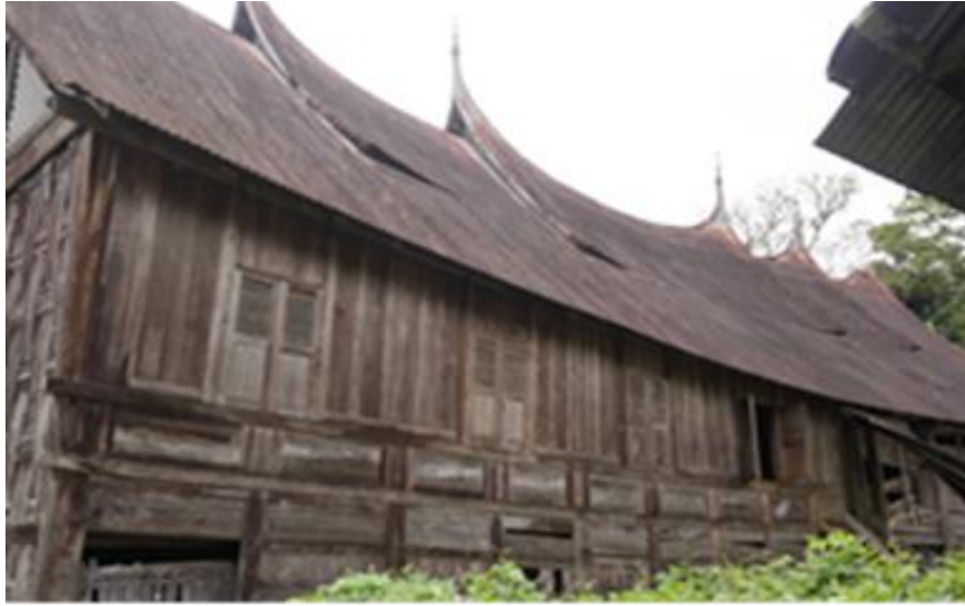
Rajah 4: Rumah gadang 7 bilik yang terdapat di Solok, Luhak Lima Puluh Kota.

Sudirman (2007), rumah adat ialah rumah yang didiami menurut aturan dan norma-norma adat yang disebut “babiliak ketek, babiliak gadang” (berbilik kecilnya, berbilik besar).