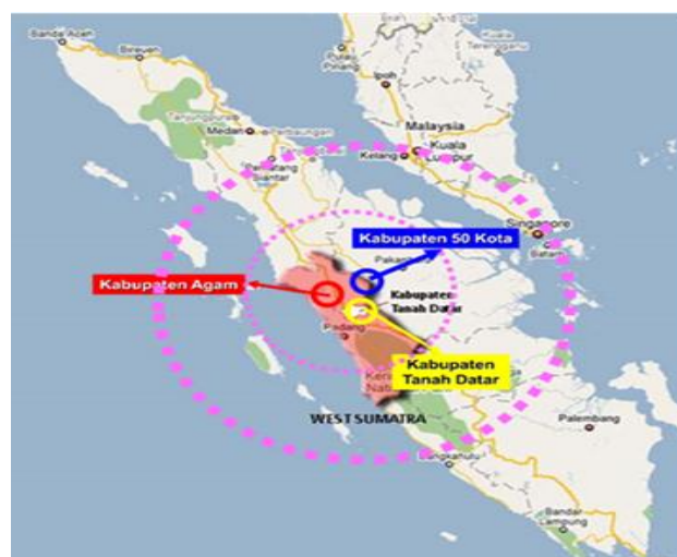
Rajah 2 : Gelombang penghijrahan Minangkabau

Masyarakat Minangkabau mempunyai prinsip serta tujuan migrasi yang sama iaitu meneroka kawasan yang subur, seperti di kawasan hutan, membuka ladang yang subur untuk ekonomi seperti lada, padi dan lain-lain. Lokasi yang subur ini membuat mereka berpindah ke kawasan di tepi sungai-sungai besar dekat muara dan laut. Kawasan tersebut dari segi ekonomi ketika itu adalah jauh lebih menguntungkan daripada Induk Minangkabau di dataran tinggi Bukit Barisan. Penghijrahan masyarakat Minangkabau dari satu tempat untuk tinggal ke satu tempat yang lain merupakan penghijrahan etnik baru ke satu-satu kawasan yang belum diteroka dan yang telah diteroka ia akan saling berkaitan dengan kedatangan kelompok masyarakat. Menurut tukang rumah tradisional dari Kampar kiri, Pak Suwar 82 tahun, mengatakan nenek moyang beliau telah merantau lebih kurang 200 tahun yang lalu ke Selat Melaka untuk berdagang dan telah pulang semula ke kampung halaman. Kedatangan mereka pada satu-satu masa dalam bentuk orang perseorangan atau kumpulan kecil kerana tiba dan tidak tinggal secara tetap tetapi sering bergerak, kerana pola kehidupan seharian keluar dari satu tempat ke satu tempat yang lain dalam mendapatkan bahan dagangan.