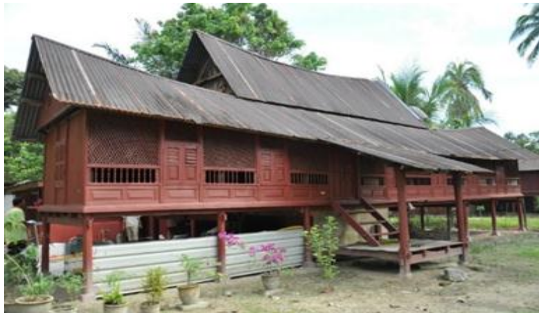
Rajah 19 : Rumah Negeri Sembilan berserambi dua.

Serambi terdiri dari serambi hujung, serambi tengah dan serambi pangkal. Serambi yang paling hampir dengan tangga di panggil serambi pangkal, menunjukkan ia adalah serambi pangkal dan paling jauh di panggil serambi hujung. Dalam pada itu menurut Yaakub Idrus (1996), terdapat empat (4) jenis variasi yang berdasarkan kepada penambahan di bahagian serambi seperti jenis tidak beranjung, jenis beranjung satu, jenis beranjung dua dan jenis beranjung tiga (rujuk rajah 16, 17, 18, 19 dan 20) Rumah beranjung adalah rumah berevolusi yang pada asalnya bermula dari jenis rumah tidak beranjung seperti dalam (rajah 15).