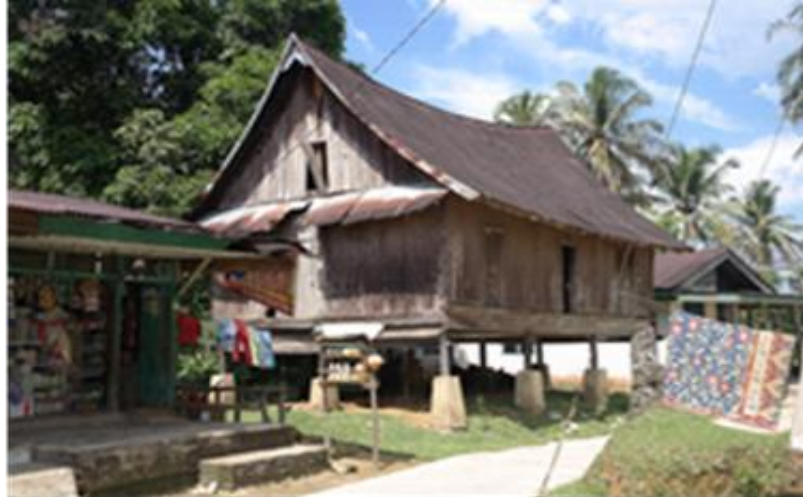
Rajah 7 : Rumah Kampar yang banyak terdapat di lipat kain, Kampar kiri (tipologi 2).

Setiap bahagian ini mempunyai fungsinya yang tersendiri mengikut kepada keperluan sama ada pada waktu harian biasa atau semasa mengadakan majlis-majlis adat. Merujuk kepada (rajah 7), fungsi ruang pada rumah Kampar ini juga mirip kepada rumah Negeri Sembilan. Rekabentuk rumah Negeri Sembilan mempunyai beberapa tipologi yang mengikut ruang serambi di mana serambi yang dekat dengan tangga dipanggil serambi pangkal dan serambi yang jauh dengan tangga di panggil serambi hujung. "Pangkal untuk orang adat, hujung untuk orang syarak dan penghulu" (Nafida 2007). Selain serambi, ruang-ruang lain seperti rumah ibu (tengah rumah dan bilik) serta loteng (peran) juga terdapat pada rumah tradisional Negeri Sembilan dan mempunyai fungsi yang sama seperti pada rumah induk dan Kampar-siak.