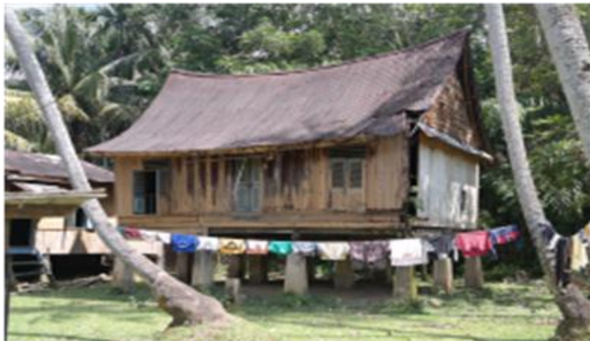
Rajah 6 : Rumah Kampar yang banyak terdapat di lipat kain, Kampar kiri (tipologi 1).

Rumah gadang adalah dalam bahasa minangkabau yang bermakna rumah besar bagi etnik orang Minangkabau dikenali juga sebagai rumah adat Minangkabau yang mengikut sistem kekerabatan matrilineal. Menurut Sudirman (2007), senibina tradisional Minangkabau terutama rumah gadang atau juga rumah adat dapat disebut sebagai bangunan vernicular yang lahir dari budaya masyarakat yang mengamalkan sistem kekerabatan matrilineal. Dalam sistem ini, kaum perempuan adalah pewaris kepada rumah gadang ini. Ia diwariskan kepada ibu, ibu kepada anak perempuan di bawah pemimpin kaum/suku yang lazim disebut dengan mamak kaum. Rumah adat ini mempunyai struktur bumbung melengkung dramatik dengan tebar layar dan rabung melengkung. Terdapat juga prinsip-prinsip tertentu dalam pembinaan rumah adat Minangkabau (Syamsul Asri: 2004). Sebahagian besar rumah ini dibina daripada gabungan buluh, kayu berukiran yang melambangkan adat mereka. Motif ukiran biasanya daripada reka bentuk bunga dengan struktur geometri dan ada kalanya mirip dengan tektik tenunan songket Minangkabau.