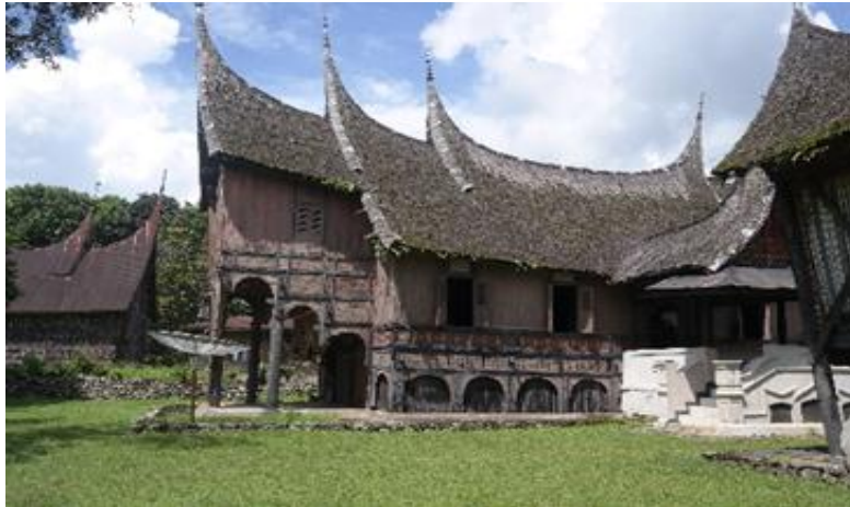
Rajah 11 : Rumah gadang Luhak Tanah Datar.

Luhak Tanah Datar merupakan luhak sulung, tertua, pemilik adat, raja, ibu dan tuah. Rumah gadang di Luhak Tanah Datar yang disebut juga gajah maharam ini dinamakan sitinjau laulik . Rumah gadang ini mengikut sistem adat Koto Piliang. Rumah ini lebih rumit dan lebih cantik berbanding dengan luhak yang lain seperti di Muzium Pagarruyung. Rumah jenis ini masih banyak terdapat di Batu Sangkar dan daerah Tanah Datar. Kedua ujung rumah diberi beranjung yang lantai ditinggikan disebut juga rumah baanjuang (rumah berpanggung). Kemegahan bentuk rumah ini dengan bumbung bergonjong yang berlapis-lapis serta mempunyai banyak ornamen-ornamen. Tangga dan pintu masuk pada depan rumah serta di tengah-tengah. Luhak Agam adalah luhak kedua atau luhak tengah. Rumah gadang di luhak Agam disebut serambi papek mengikut sistem adat Bodi Candiago. Reka bentuk rumah gadang yang sederhana, tidak menonjolkan kemewahannya mempunyai ciri bentuk gonjong yang bersayap di kedua hujung bawahnya. Lantai rumah ini datar dan tanpa anjung serta perletakkan tangganya di belakang.