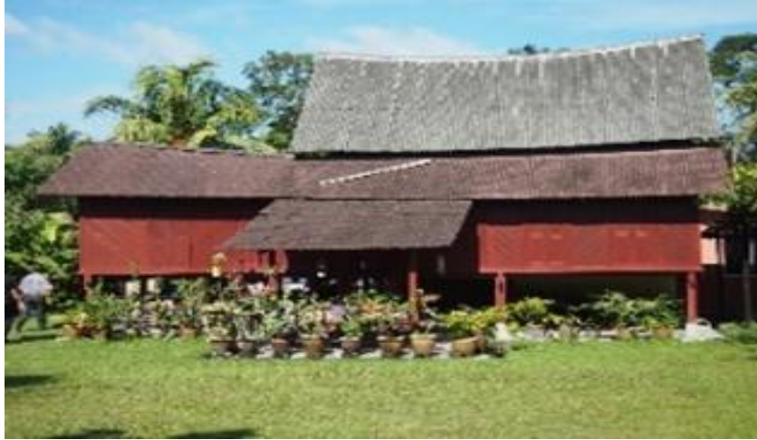
Rajah 16 : Rumah Negeri Sembilan berserambi satu.

Menurut Yaakub Idrus (1996) rumah Negeri Sembilan, bumbungnya kelihatan sedikit rendah dan lentik sedikit, mempunyai bumbung bertingkat antara atap bumbung rumah ibu dan atap serambi. Lazimnya rumah beranjung bagi rumah ketua-ketua adat dan pembesar-pembesar (Raja Nafida: 2007), yang lain mempunyai saiz dan gaya senibina yang berbeza dan ini dapat dilihat dengan jelas pada ruang serambinya.