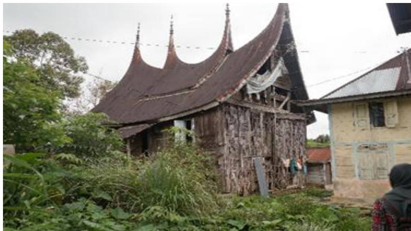
Rajah 12 : Rumah gadang Luhak Lima Puluh Kota.

Luhak Tanah Datar merupakan luhak sulung, tertua, pemilik adat, raja, ibu dan tuah. Rumah gadang di Luhak Tanah Datar yang disebut juga gajah maharam ini dinamakan sitinjau laulik . Rumah gadang ini mengikut sistem adat Koto Piliang. Rumah ini lebih rumit dan lebih cantik berbanding dengan luhak yang lain seperti di Muzium Pagarruyung. Rumah jenis ini masih banyak terdapat di Batu Sangkar dan daerah Tanah Datar. Kedua ujung rumah diberi beranjung yang lantai ditinggikan disebut juga rumah baanjuang (rumah berpanggung). Kemegahan bentuk rumah ini dengan bumbung bergonjong yang berlapis-lapis serta mempunyai banyak ornamen-ornamen. Tangga dan pintu masuk pada depan rumah serta di tengah-tengah. Luhak Agam adalah luhak kedua atau luhak tengah. Rumah gadang di luhak Agam disebut serambi papek mengikut sistem adat Bodi Candiago. Reka bentuk rumah gadang yang sederhana, tidak menonjolkan kemewahannya mempunyai ciri bentuk gonjong yang bersayap di kedua hujung bawahnya. Lantai rumah ini datar dan tanpa anjung serta perletakkan tangganya di belakang.