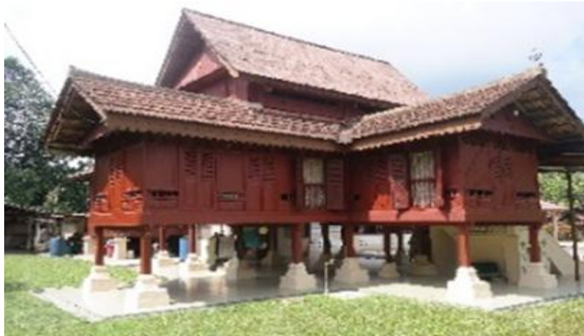
Rajah 20 : Rumah Negeri Sembilan berserambi dua dan beranjung.