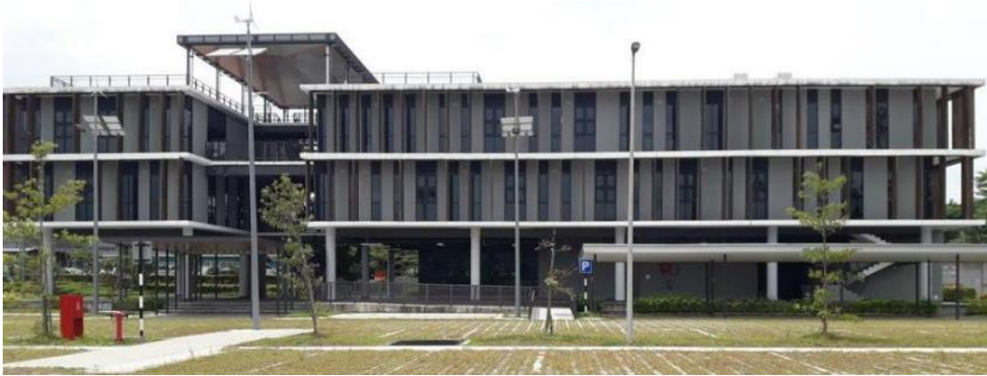
Gambarajah 4: CIDB Headquarters, antara bangunan rekaan Razin Mahmood yang direkabentuk berinspirasi elemen seni bina Melayu tradisional.

Selain daripada penolakan kepada unsur perlambangan di dalam rekabentuk bangunan, Razin Mahmood juga menolak idea peniruan kepada unsur fizikal bangunan tradisional ke dalam rekabentuk bangunan moden bagi menonjolkan identiti kemelayuan. Bagi Razin sendiri, rekabentuk beridentiti Melayu tidak seharusnya terikat dan dilihat kepada rekabentuk fizikal sahaja, seperti bentuk bumbung Melayu, ataupun sebagainya. Apa yang lebih penting adalah penerapan budaya dan kerohanian, yang mana akan melahirkan identiti secara semulajadi. Razin Mahmood mengadaptasi konteks kebudayaan di negara Jepun yang diterapkan di dalam rekabentuk sehingga menjadi identiti kepada seni bina Jepun. Razin Mahmood lebih mementingkan pengisian, kerohanian dan kebudayaan di dalam membentuk bangunan beridentiti Melayu, seterusnya menjadi suatu bahasa identiti seniibina nasional yang lahir secara semula jadi. (Mahmood, 2018)