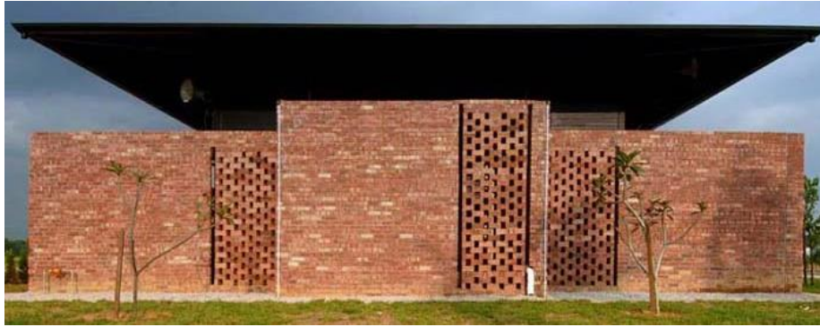
Gambarajah 2: Surau Nusajaya Rekaan Razin Mahmood, dibina secara praktikal, mencerminkan nilai tanggungjawab (responsibility) di dalam rekaannya.

Secara spesifiknya, Razin Mahmood mula mengadaptasi elemen seni bina Melayu tradisional di dalam skema rekabentuknya pada projek renovasi rumahnya sendiri, 'The Molek House'. Disebabkan projek ini adalah projek miliknya sendiri, beliau memilih untuk mengeksplorasi rekabentuk, dengan memberi nafas kemelayuan pada rekabentuk ini. Salah suatu elemen bangunan Melayu tradisional yang diadaptasi ialah jendela labuh, di mana elemen ini diaplikasi pada ruangan dalam rumah tersebut. Di samping itu, Razin Mahmood juga telah mengubah pelan lantai asal rumah tersebut, dengan mengintegrasikan perancangan ruang Melayu pada susunan bilik tidur utama dan ruang tamu, dan perancangan susunatur gaya barat dan moden pada ruangan bilik air dan juga almari pakaian. Manakala, dari sudut penggunaan bahan binaan, Razin Mahmood telah menggunakan bahan binaan moden pada jendela labuh yang diadaptasi dari elemen bangunan Melayu tradisional ini. Jika pada zaman tradisi dahulu, bangunan binaan adalah kayu sepenuhnya, Razin Mahmood telah menggunakan MDF Board , dan juga Frosted glass untuk membina jendela labuh moden di rumahnya. (Mahmood, 2018)