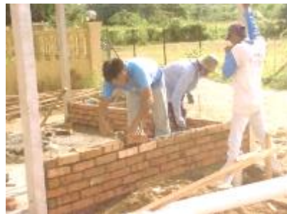
Gambarajah 4: Pembinaan tandas dan tempat wudhu