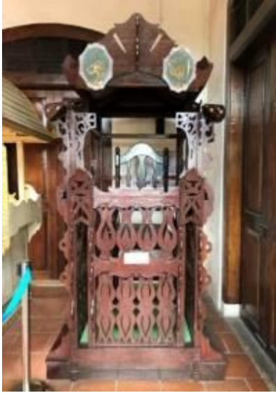
Gambarajah 12: Mimbar asal Masjid Warisan Kampung Parit Melana yang kini dipamerkan di Muzium Islam Melaka.