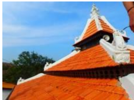
Gambarajah 6: Masjid Warisan Kampung Parit Melana mempunyai bumbung tiga lapis.