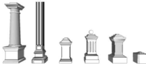
Gambarajah 11: Rekabentuk tiang utama dan tiang-tiang sokongan yang terdapat pada bangunan masjid lama ini.

Bagi bahagian kemas bangunan untuk elemen lantai, masjid ini menggunakan kemas terracotta dan kemudiannya dihamparkan dengan permaidani khususnya di bahagian dewan solat. Menurut sumber temubual, struktur lantai dahulunya dibina dari kayu keras dan kemudiannya digantikan dengan lapisan papak lantai yang bersimen dan dibina setinggi 1 meter dari aras tanah. binaan bata laterit Lantainya setinggi 1 meter dari aras tanah.