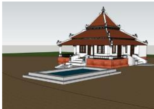
Gambarajah 1: Ilustrasi masjid bersama kolam takungan berdasarkan gambaran penduduk.

Menurut pendapat salah seorang penduduk kampung ini, Puan Kamariah Sahat telah memberi gambaran mengenai keadaan sekeliling masjid tersebut yang dikelilingi tanaman sawah padi. Di kawasan berbukit iaitu di bahagian belakang masjid ini terdapat tanaman pokok getah yang menjadi sumber ekonomi utama penduduk kampung pada ketika itu. Menurutnya lagi, terdapat sebuah kolam takungan air mata air yang menjadi tumpuan penduduk kampung kerana ianya adalah sumber air utama di kawasan tersebut. (Rujuk Gambarajah 1 dan 2 bagi gambar foto dan ilustrasi masjid). Kolam takungan tersebut dikatakan berteluk di bahagian tengahnya yang berkemungkinan adalah titik punca mata air tersebut. Kolam itu juga mempunyai pelantar kayu dan kedalaman kolam adalah kira-kira sedalam paras pinggang. Kolam takungan sebesar ini dijadikan tempat mandi, tempat berwudhu dan tempat menjalankan aktiviti seperti mencuci pakaian di situ. Air dari takungan ini dibentuk saliran keluarnya ke arah kawasan sawah padi yang berhampiran. Menurut sumber dari temubual, air mata air ini dikatakan mula kering sejak kuari berhampiran dibuka. Sejak itu, kolam ini tidak lagi digunakan dan dirobohkan untuk membina tandas dan tempat berwudhu yang ada pada hari ini.