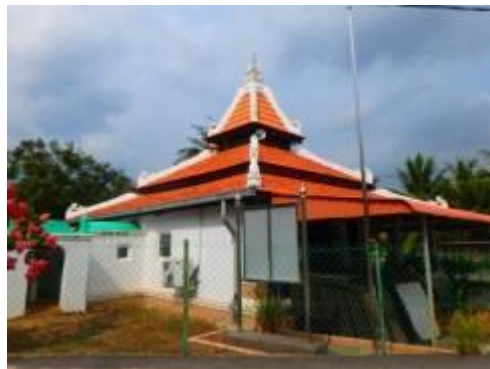
Gambarajah 2: Pandangan belakang masjid.