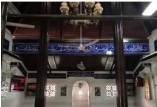
Gambarajah 13: Gambar dalaman masjid.