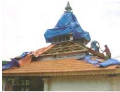
Gambarajah 3: Pemasangan genting Marseille pada lapisan bumbung kedua dan ketiga

Masjid Warisan Kampung Parit Melana pernah mengalami kerosakan dari tahun 1972 hingga tahun 2002. Sepanjang tempoh tersebut, kerja-kerja pembaikan telah diusahakan oleh penduduk dan juga pihak yang bertanggungjawab seperti PERZIM. Usaha yang dijalankan adalah bertujuan untuk memelihara masjid supaya bangunan tersebut dapat terus digunakan selain mengekalkan elemen pensejarahan bangunan tersebut. Bagi memastikan kesinambungan penggunaan masjid lama ini, beberapa penambahbaikan telah dibuat antaranya membaiki dan menukar atap lama, mendirikan tandas moden dan menambah bilik stor bagi tujuan penyimpanan barang-barang gunasama penduduk (Gambarajah 3 dan 4). Pembaikan dan pengubahsuaian melalui pembinaan tambahan ini antara lainnya bagi memberi keselesaan dan kemudahan kepada ahli jawatankuasa masjid serta pengguna tidak kira samada kepada penduduk setempat mahupun mereka yang singgah untuk menunaikan solat.