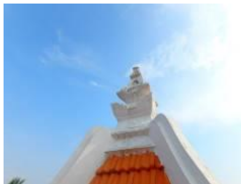
Gambarajah 8: Mahkota atap yang terletak di bahagian paling atas bumbung.

Terdapat satu ukiran yang berada di atas bumbung yang paling tinggi dikenali sebagai Mahkota Atap (rujuk Gambarajah 8). Dikatakan ianya diperbuat daripada batu karang yang ditumbuk hancur lalu diadun bersama telur bagi melekatkan bahan tersebut dan kemudiannya dibentuk menjadi satu arca yang dinamakan mahkota atap masjid. Disesetengah kawasan nusantara lain, ornamen ini dikenali dengan nama 'Martabha' atau 'Martaba'.