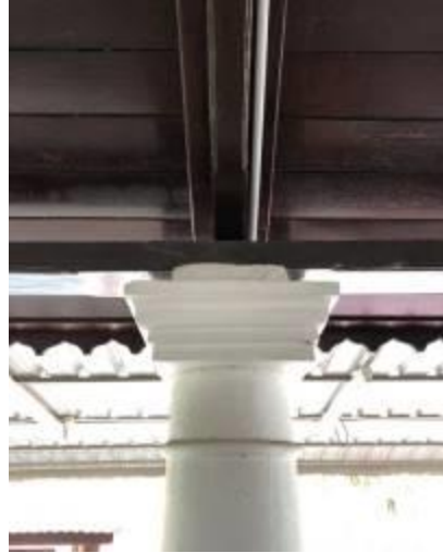
Gambarajah 10: Struktur tiang masjid dibahagian balkoni.

Dewan sembahyang utama Masjid Warisan Kampung Parit Melana ini dikelilingi dinding batu yang diperbuat dari tanah laterit. Ia direkabentuk pula dengan mempunyai empat batang tiang utama di tengah ruang dewan solat. Fungsi tiang utama ini adalah sebagai struktur tiang yang menyokong bumbung tiga lapis masjid ini (Gambarajah 10 dan 11).