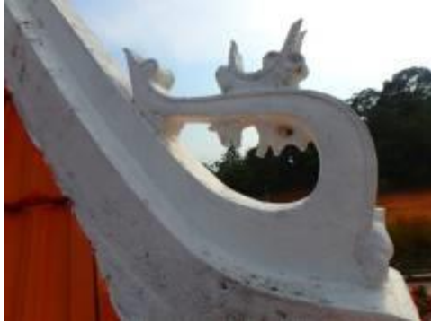
Gambarajah 7: Perabung sulur bayu

Kaedah struktur rangka utama adalah melalui penggunaan teknik tiang dan rasuk. Pelan masjid ini berbentuk petak disertai dengan tiga lapis bumbung yang diakhiri dengan bumbung kecil berbentuk piramid di bahagian paling atas (rujuk Gambarajah 6). Bumbung yang paling atas dinaikkan lebih tinggi berbanding dua bumbung di bawahnya. Di bawah bumbung teratas terdapat tingkap 'klerestori' yang berfungsi bagi mengalakkan cahaya semulajadi dan pengudaraan untuk masuk melalui tingkap tersebut. Setiap perabung bumbung itu mempunyai ukiran 'sulur bayu' yang mempunyai sedikit pengaruh Senibina Cina (Gambarajah 7).