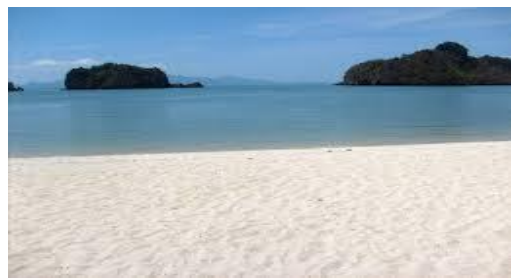
Pantai Tanjung Rhu