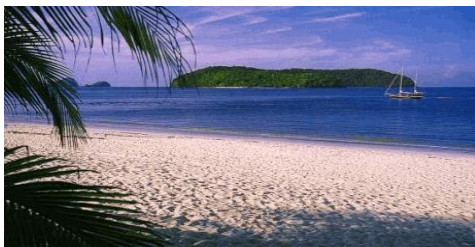
Pantai Tengah, Langkawi