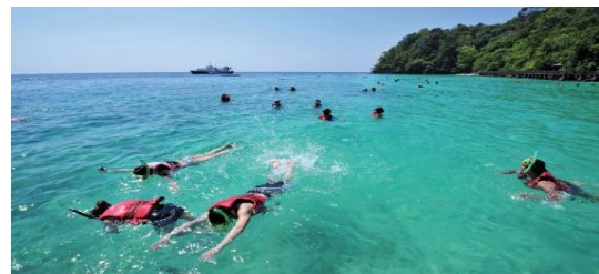
Pulau Payar Marine Park, Langkawi