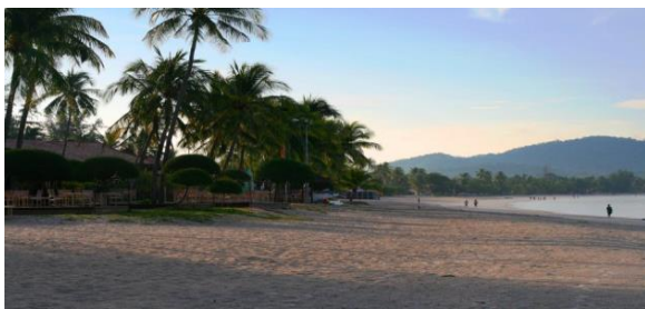
Pantai Pasir Tengkorak