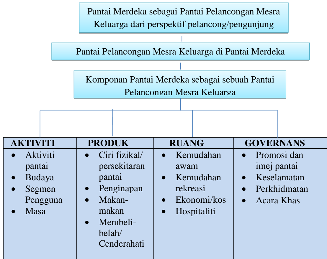
Rajah 2. Model kendalian