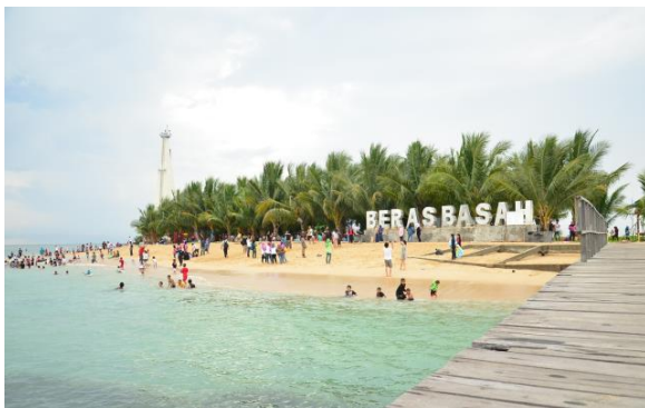
Pulau Beras Basah, Langkawi