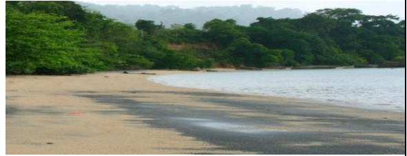
Pantai Pasir Hitam, Langkawi