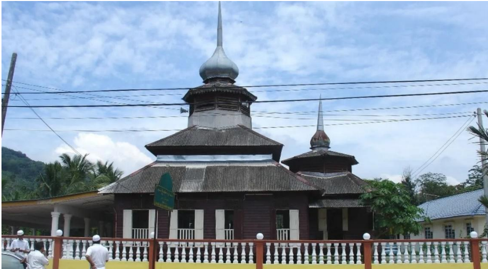
RAJAH 2. Masjid Mendum, 1928

Contoh dari ciri atau gaya seni bina Eropah yang diterangkan juga dapat diperhatikan pada Bangunan Pejabat Pos Lama Ipoh, Perak yang telah dibangunkan sekitar 1913 dan siap pada 1916. Bangunan Pejabat Pos ini direka oleh arkitek British A.B Hubback dan terletak di tengah-tengah pusat Bandar lama Ipoh yang merupakan kawasan pentadbiran kerajaan yang utama pada zaman Inggeris ketika itu. Bangunan ini mempunyai seni bina Roman dan Renaissance yang unik. Bangunan dua tingkat ini juga dikelilingi arked terbuka atau verandah di tingkat atas dan bawah. Arked ini dihias dengan tiang dan gerbang separuh bulatan menonjolkan ciri-ciri Greek dan Roman manakala dinding verandah di tingkat atas dibina dengan corak victorian yang ringkas.