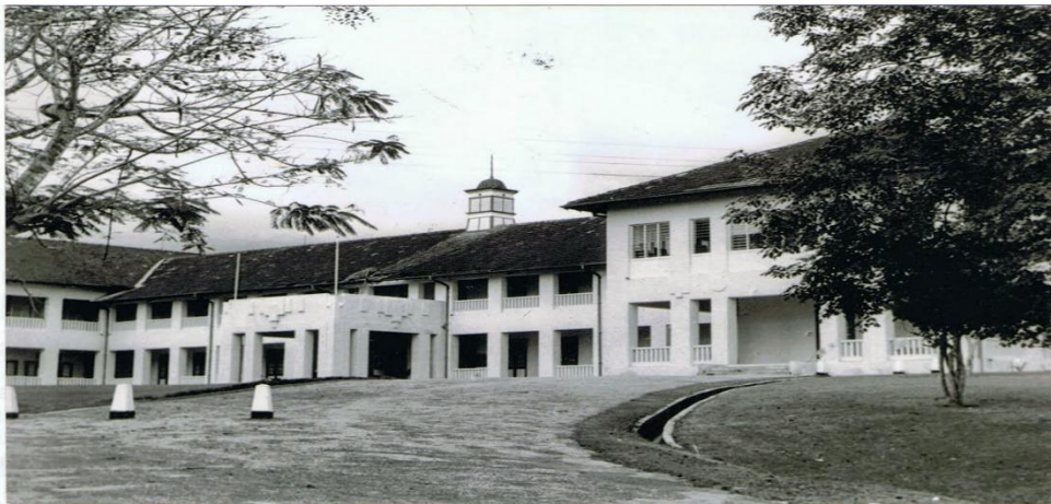
RAJAH 1. Kajang High School, 1914

Perbincangan dalam bahagian ini akan meliputi aspek struktur bandar, morfologi bandar dan rupa bandar dengan merujuk kesan dari dasar pembangunan kolonial dari tahun 1914 hingga 1940 di NNMB. Ciri pembandaran di NNMB dalam perkembangan kolonial lebih bersifat Eropah seperti Neo-klassik, Neo Ghotik, Moorish dan Tudor. Malah boleh diperhatikan bahawa ciri Eropah telah menjadi asas atau acuan wajib dalam struktur seni bina seterusnya. Walaubagaimanapun, kebanyakannya mempunyai keunikan tersendiri dan berbeza-beza seperti berkeunikan tropika atau mewakili adat dan budaya masyarakat kerana akan dibangunkan sesuai dengan asimilasi dari ciri campuran. Bangunan bertingkat tinggi dan perumahan moden telah dibina secara meluas di banyak kawasan bandar dengan penyesuaian konsep baru dalam perancangan, bahan dan gaya, yang menggantikan corak seni bina tradisional dengan pesat. Dengan itu, penggunaan konsep hidup barat telah menggalakkan penduduk tempatan untuk membina rumah yang menggabungkan gaya seni bina barat dan cirinya. Kebanyakan ciri ini dapat diperhatikan dari seni bina sekolah-sekolah yang dibangunkan kolonial seperti Kajang High School yang ditubuhkan pada 1914.