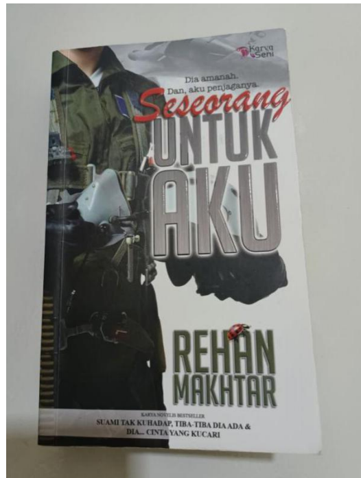
GAMBAR 1: Novel “Seseorang Untuk Aku” sebagai sampel kajian.

Berdasarkan pemerhatian awal, didapati setiap bab mempunyai jalan penceritaan yang mengandungi kata adverba dalam ayat. Setiap bab juga mengandungi peserta, proses dan keterangan. Cara penyampaian cerita dalam novel ini mengandungi halaman berkembar dan komponen ideasional. Novel ini menggunakan bahasa Melayu sepenuhnya dalam penceritaan.