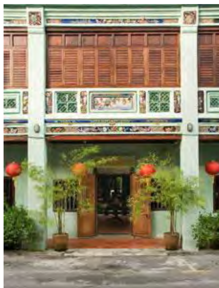
Rajah 1. Gambar Rumah Koh Lay Huan (Generasi Pertama)

Koh Lay Huan juga melibatkan diri dalam pertubuhan Cina bagi mengukuhkan kuasa dan pengaruhnya di Pulau Pinang. Pada tahun 1825, terdapat sekurang-kurangnya tiga “ hu ” (pertubuhan) di Negeri-negeri Selat iaitu Ghee Hin 7 , Ho Seng dan Hai San 8 . Walau bagaimanapun, terdapat sesetengah pihak yang mengatakan Pulau Pinang pada awal tahun 1780-an mempunyai lima pertubuhan kongsi gelap iaitu Ghee Hin, Ho Seng, Hai San, Chin Chin dan Toh-peh-kong 9 . Pertubuhan ini merupakan pertubuhan kongsi gelap dan biasanya orang yang berpengaruh sahaja akan menjadi ketua bagi pertubuhan tersebut. Di samping itu, rumah Koh Lay Huan terletak di No. 25, Lebuh China, Pulau Pinang kerana jalan tersebut merupakan kediaman Koh Lay Huan-penghuni China pertama dan peniaga di Pulau Pinang 10 . Rumah tersebut (Rajah 1) kini tersenarai bawah Tapak Warisan Dunia UNESCO George Town dan dikenali sebagai East Indies Mansion yang menawarkan perkhidmatan perhotelan.